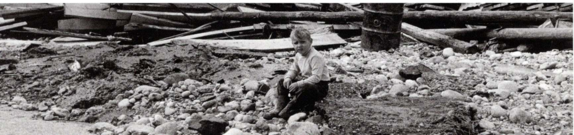
Erinnerungen von Zeitzeugen (Film Ausstellung)

Vernissage 22. Oktober, 18 Uhr im Gemeindesaal Restaurant Schlossgut