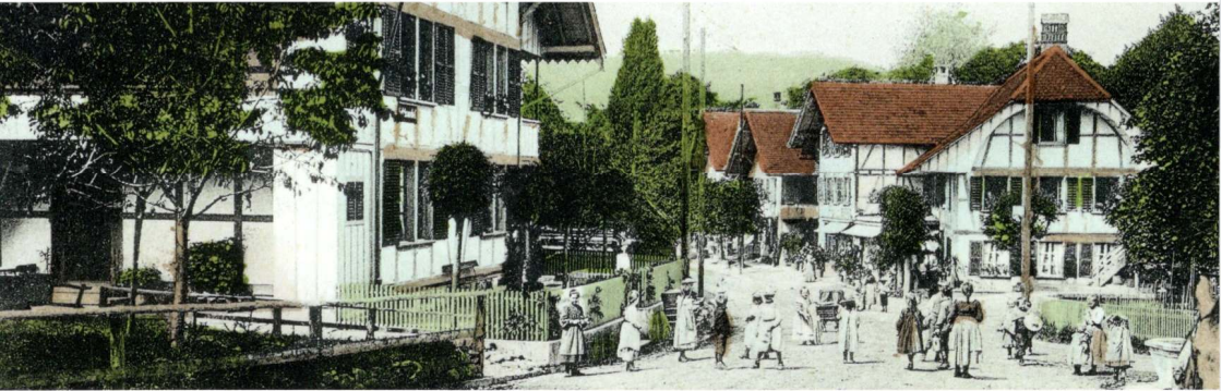
Münsingen: Vom Bauerndorf zur halbstädtischen Siedlung, 21. Februar 2011, 19:30 Uhr (Bildvortrag)

Sonderausstellung Museum Schloss Münsingen 22. Oktober 2010 – 17. April 2011