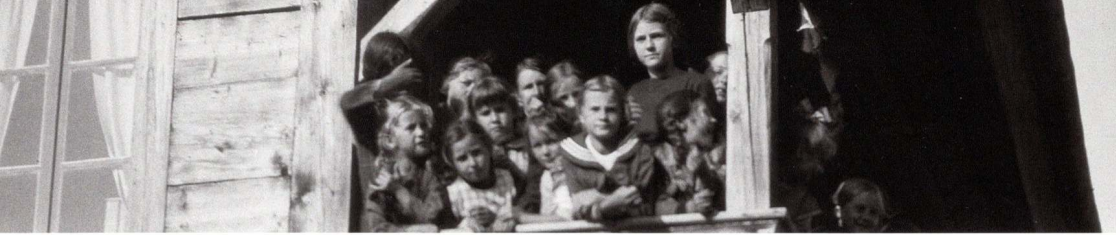
Ferienkolonie in der Südere, 21. Januar 2011, 19–20 Uhr (Zeitzeugengespräch)