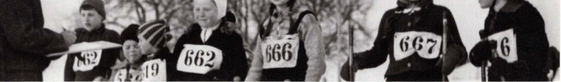
Schülerrennen Ballenbühl, 14. Januar 2011, 19–20 Uhr (Zeitzeugengespräch)