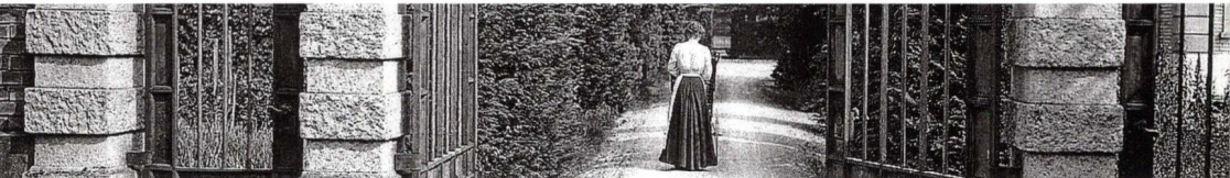
«Matto regiert», 22. Januar 2011, 19 Uhr (Film)