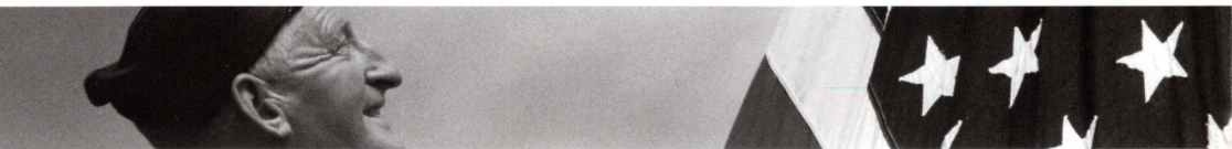
Spuren des Weltgeschehens im Dorf, 21. März 2011, 19.30 Uhr (Bildvortrag)