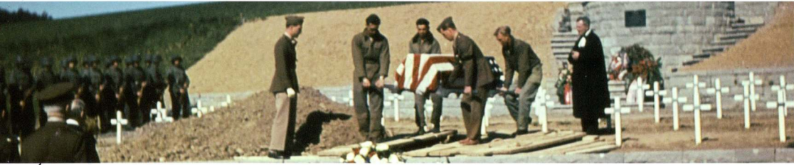
Amerikanerfriedhof und US-Soldaten in der Schweiz, 28. Januar 2011, 19–20 Uhr (Zeitzeugengespräch)